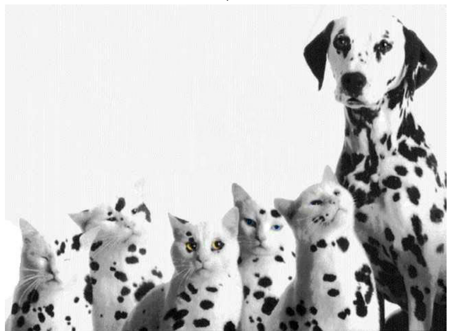
Zijn vlekjes besmettelijk??

Roodvonk komt door een bacterie; de andere ziekten worden door virussen veroorzaakt. De virussen en bacteriën komen het lichaam binnen via de mond of de neus. Ze zitten in het speeksel van iemand die besmet is en in druppeltjes die uitgehoest of uitgeniest worden. Ook via handen kunnen de virussen en bacteriën zich verspreiden.