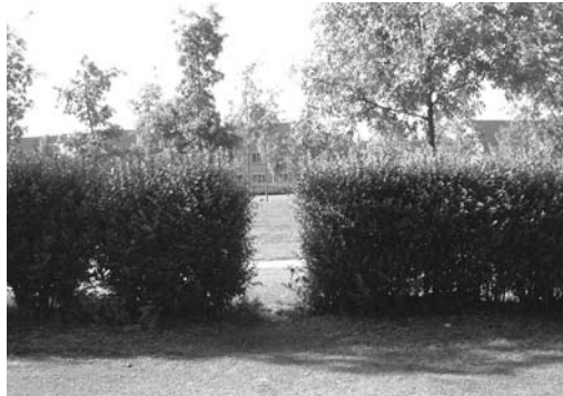
Het gat in de heg...

Noten heeft de aannemer gevraagd een offerte te maken voor een hekwerk, om te voorkomen dat brommers tussen de bosjes door het speelveld op rijden. Naar verwachting wordt in