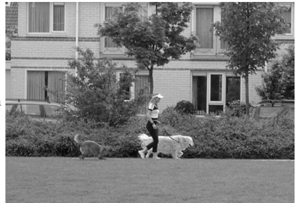
Hond uitlaten op het Buurtven, ookal mag het ook nu niet....

Hondenbezitters in Gijzenrooi en Tivoli kunnen komend najaar een brief thuis verwachten met locaties voor uitlaatmogelijkheden voor de hond en hierin zal nadrukkelijk vermeld staan dat op het gehele Buurtven honden niet zijn toegestaan.