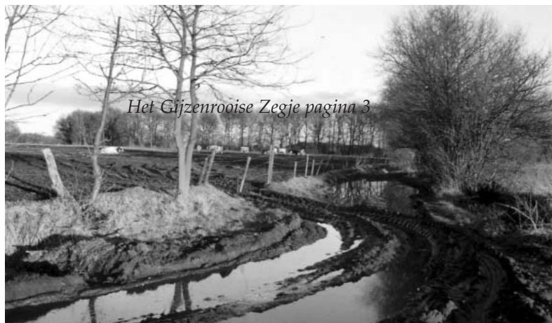
Het Gijzenrooise Zegje pagina 3