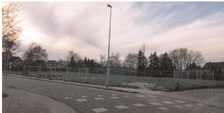
Voorlopig zijn er nog geen bouwactiviteiten aan de Bunderkensven.

Sinds kort wordt dit pakket (een enveloppe gevuld met informatie en enkele wandel-en fietsroutes) persoonlijk bezorgd bij nieuwe inwoners van Gijzenrooi. Gezien de reacties valt dit erg in de smaak.