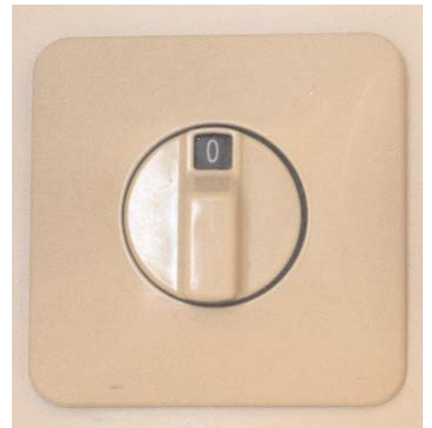
De schakelaar van het luchtverversingssysteem mag normaal gesproken gewoon op nul staan.

In het keukenkastje bevond zich een schakelaar die op twee stond. Eigenlijk nooit naar gekeken. Het bleek de schakelaar van het luchtverversingssysteem te zijn. Die stond bij ons continu op 2. "Onzin", aldus de adviseur. "Dat kost nodeloos energie. De stand 0 is goed genoeg. Dat is zijn laagste stand. Hij staat dan nog steeds niet uit; dat kan namelijk niet uit in een gesloten woning. En heb je veel vocht, bijvoorbeeld als er (net gedoucht is of je hebt zojuist gekookt, dan kun je deze schakelaar een uurtje op twee