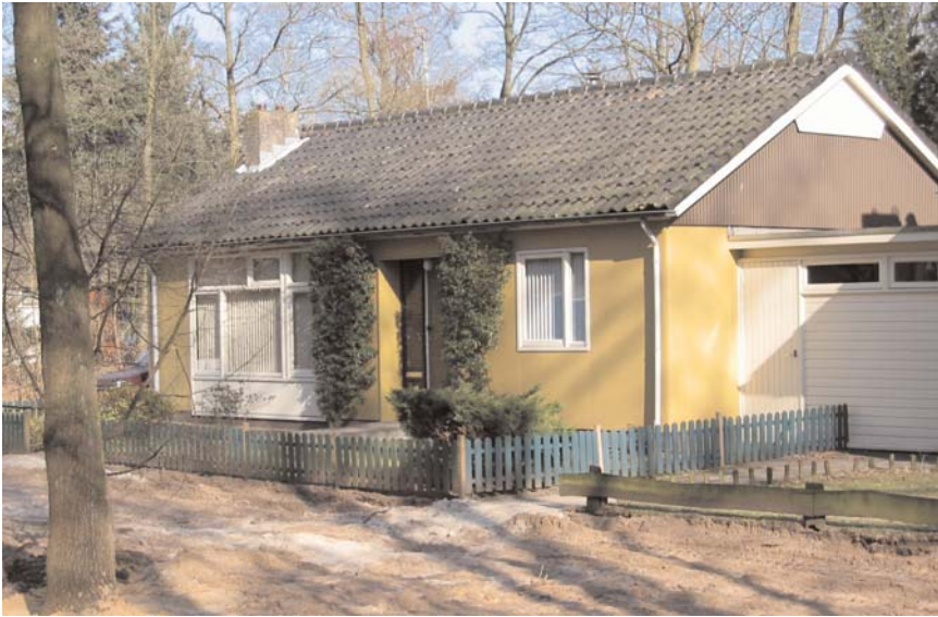
Belgische woning in Schuttersbosch

Op basis van dit bestemmingsplan ontwikkelt de eigenaar van de grond in Schuttersbosch, De Nieuwe Erven, in samenwerking met het Philips Woningbureau ten westen van de Oostenrijkse woningen een tuindorp van 253 houten woningen. Deze huizen waren oorspronkelijk bedoeld voor ambtenaren in de oerwouden van de Belgische Congo.