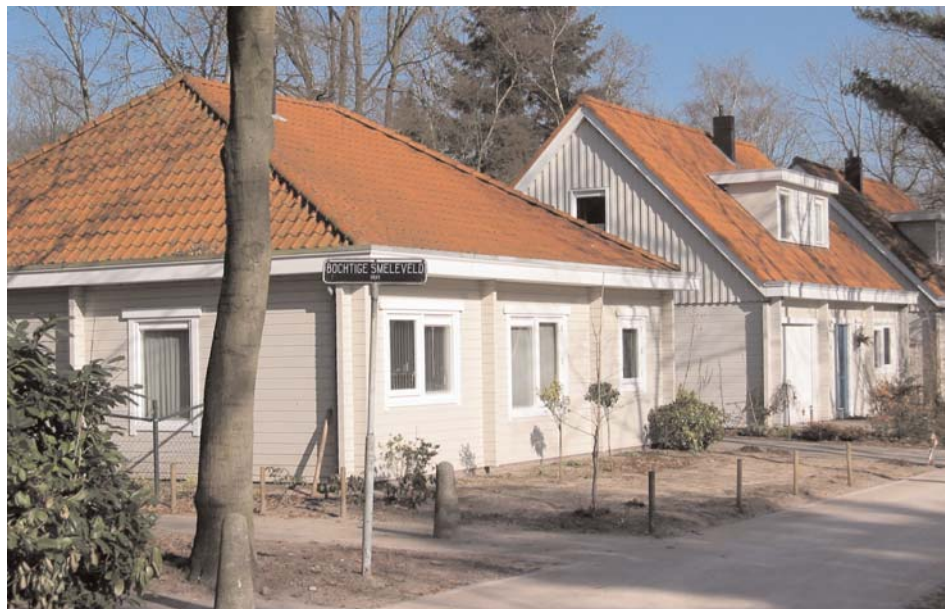
Nieuwe houten 'Finse' bungalows

Schuttersbosch stemde in met sloop en vervangende nieuwbouw echter zonder de bewoners er in te kennen waardoor grote onrust in de buurt ontstond. Het bestuur trad af en er kwam een nieuw, samen met een direct gekozen bewonerscommissie. Er is toen onderhandeld, maar pas na de uitspraak van de rechter dat er pas gesloopt mag worden na vrijwillig vertrek van de betrokken huurder, kwam er langzamerhand een beter contact met de verhuurder HHvL. Bewoners Belangenvereniging Schuttersbosch