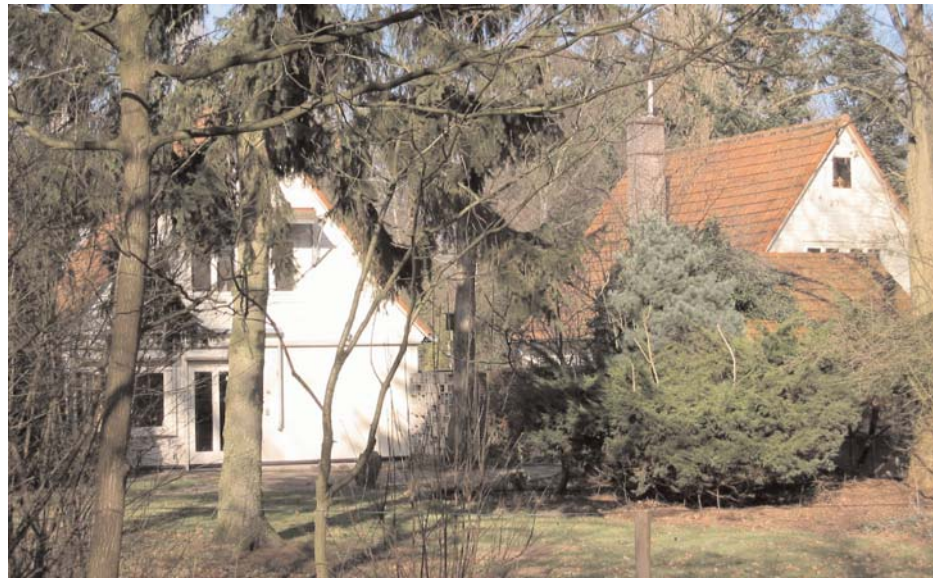
Oostenrijkse woning in Schuttersbosch

Uit deze tekst blijkt dat de gemeente zeer bewust een type woonlocatie op het oog had, vervlochten in- en overgaand naar