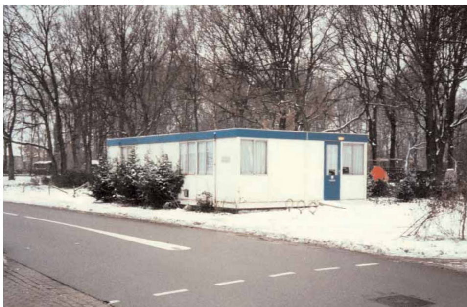
Praktijk aan het diepmeerven