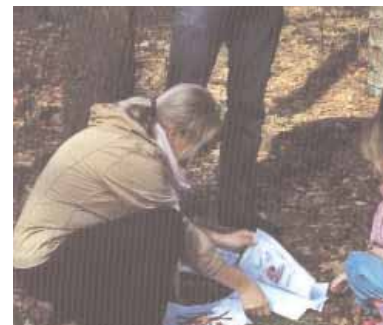
De jury aan het werk...