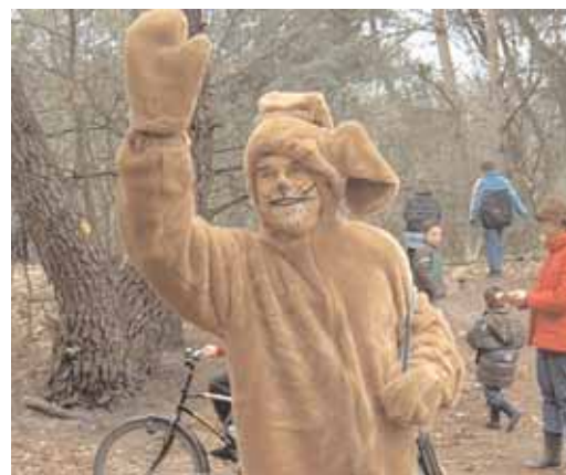
Meer hazenfoto's op pag. 11.

De paashaas had dit jaar extra eieren verstopt om alle Gijzenrooise speurneuzen flink aan het werk te houden. Als een ei werd gevonden, kon dat worden omgeruild voor een lootje. Ruim een uur renden de kinderen (en ook hun ouders!) keihard om alle eieren terug te bezorgen bij de Paashaas. Na een lekker pakje drinken, een paasnoepje en voor de ouders koffie en/of thee, werden enkele prijzen verloot en kreeg ieder kind een klein knutselpakketje voor de moeite.