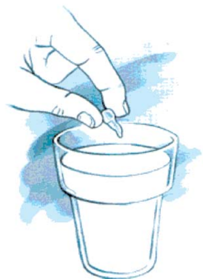
De tand kun je het beste in melk bewaren