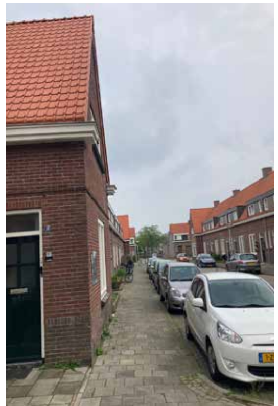
Na de doorbraak.