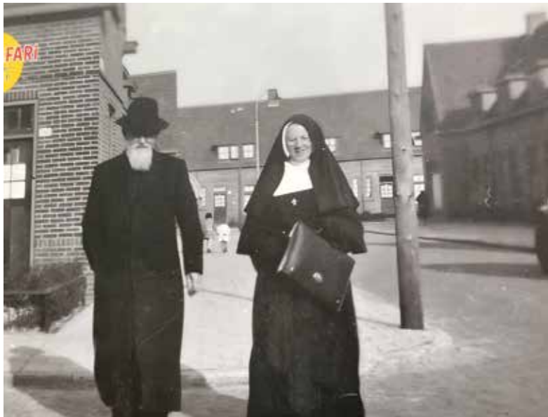
Voor de doorbraak.