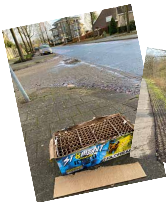
Foto-impresies tussen Kerst en Nieuwjaarsochtend