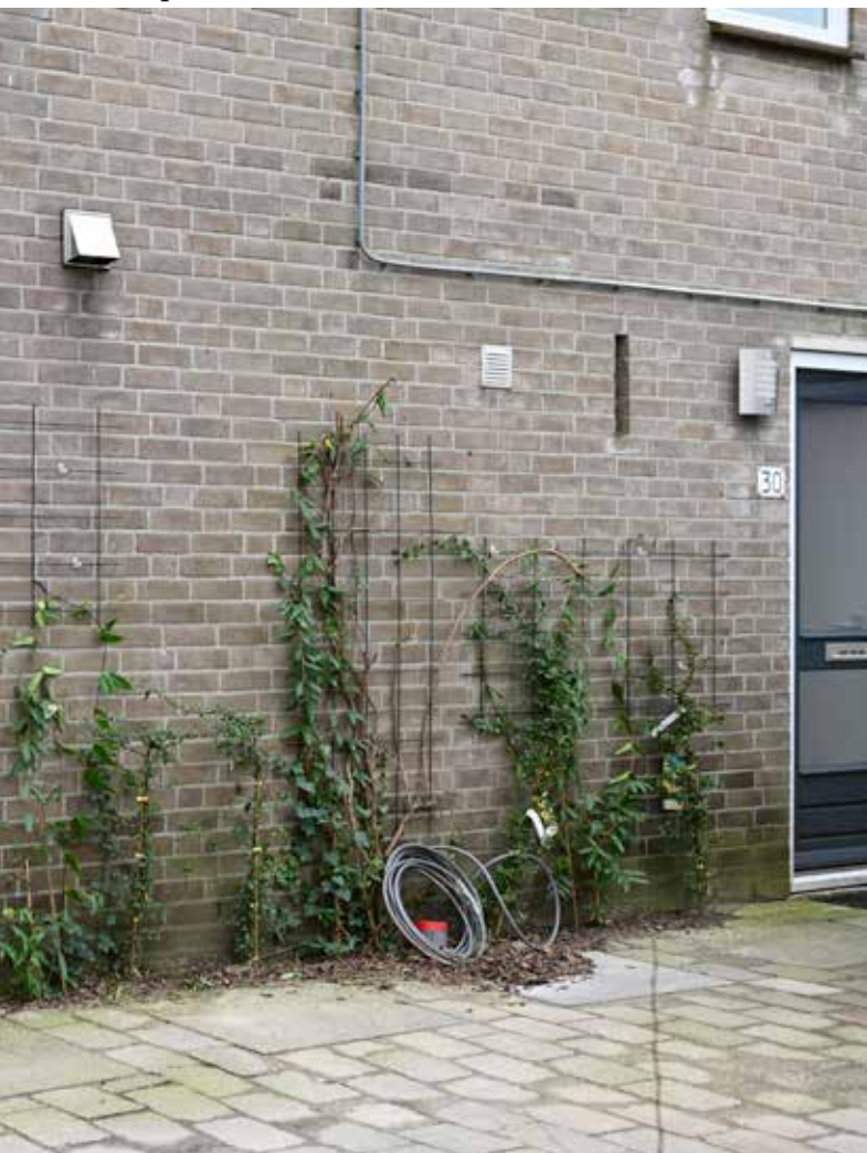
1. In 2023 geplant en over een paar jaar hopelijk een dikke, groene 'muur' vol vogelnestjes.

Nu denk je misschien: hier maakt iemand reclame. Klopt. Ik maak reclame voor meer bloemen,